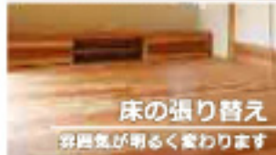
床の張り替え 空気が明るくかわります