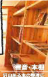
書斎・本棚 穴山ある本の整理に