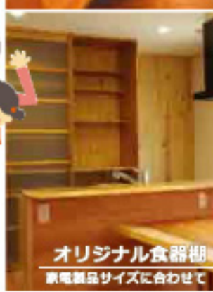
オリジナル食器棚 家電製品サイズに合わせて