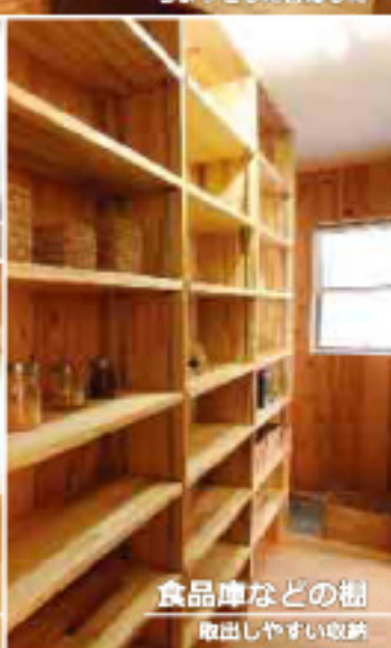
食品庫などの棚 取出ししやすい収納