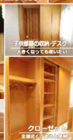
クローゼット 玄関近くは収納の便利