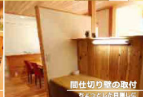
間仕切り壁の取付 ちょっとした日差しに